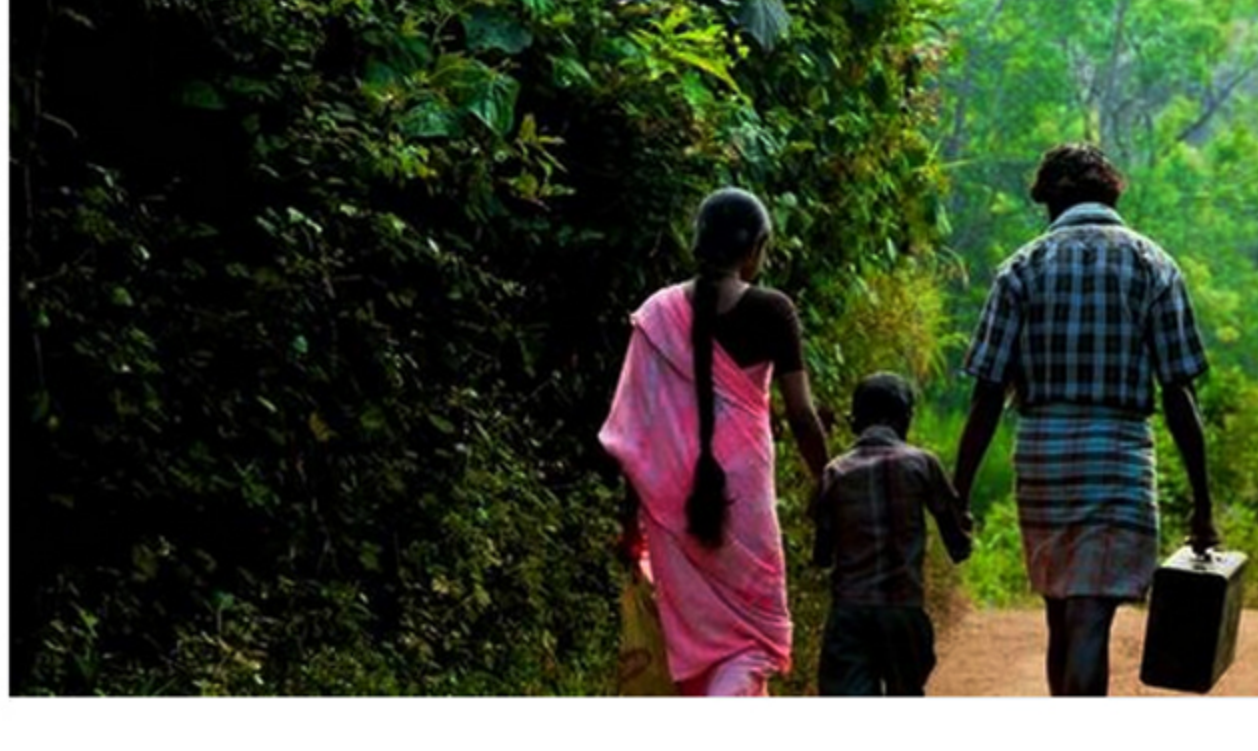
'மேற்குத் தொடர்ச்சி மலை'